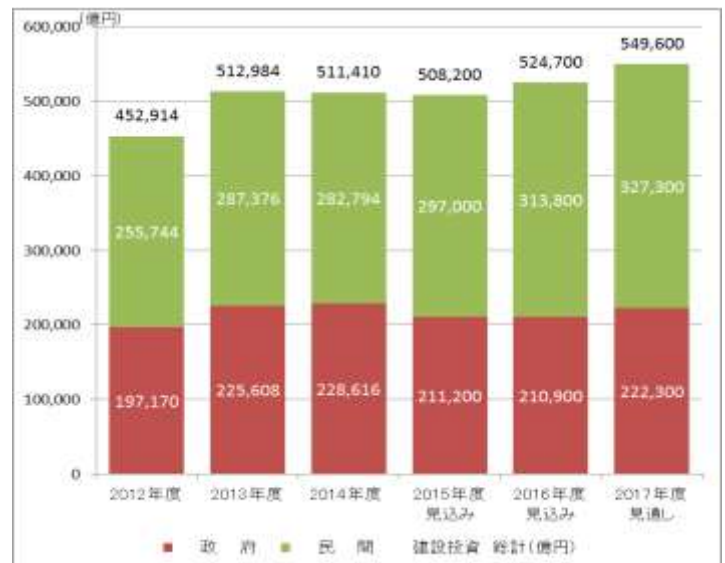
【図表③ 建設投資の見通し】

国土交通省の、「平成 29 年度建設投資見通し」によると、2017 年の建設投資の見通しは 54 兆 9600 億円(前年 104.7%)に伸びる見通しであり、ここ当面は建設業各社の旺盛な人材需要が続きます。先行指標である新規求人倍率が非常に高水準であることも踏まえると、ここ当面は建設技術者の人材不足は更に深刻化すると考えられます。