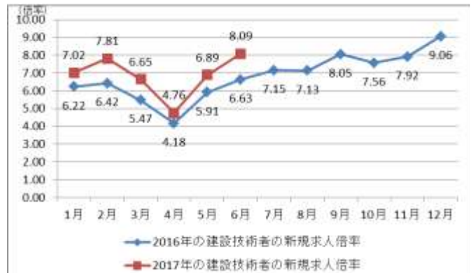
【図表② 建設技術者の新規求人倍率の推移】