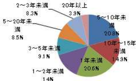
特徴2 5年以上のブランクが48%